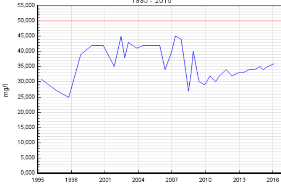
Dall Villaby Vandværk: Ammonium (mg/l) 1995 - 2016